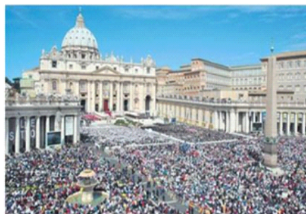
● Prema službenim podacima na Trgu sv. Petra, okolnim ulicama i drugim okupljalištima sudjelovalo je milijun i pol vjernika

Odmah nakon svečane mise našao je papa Benedikt XVI. u bazilici sv. Petra da bi počastio tjelesne ostatke novoga blaženika. Naime, u bazilici je bio izložen drveni lijes s tijelom bl. Ivana Pavla II. Premda nije riječ o lijesu u kojemu je papa pokopan prije šest godina nego o drvenoj navlaci, Sveti pismo na njemu služe je pod-