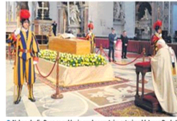
● Nakon slavlja Papa se poklonio pred posmrtnim ostacima bl. Ivana Pavla II.