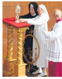
● S. Tobiána i s. Marie Simon-Pierre prinose moćnik s relikvijom

— U izjavi za Hrvatski katolički radio zagrebački je nadbiskup kardinal Josip Bozanić u osvrtnu na nedjeljno slavlje u Vatikanu primijetio da je Ivan Pavao II. odlazio u pohode mnogim zemljama, susreo se s raznim narodima na svim kontinentima: »U nedjelju, pak, kao da su ljudi iz svih krajeva svijeta uzvratili te pohode njemu sudjelujući u njegovoj beatifikaciji. Uistinu je bio veliki dan.« U izjavi za HKR kardinal Bozanić bio je i osoban: »Osjećao sam se ponosan što sam vjernik i član Katoličke Crkve. U takvim trenucima čovjek se okreće unatrag, ponovno prolazi i sjeća se mnogih ugodnih situacija i na nov način proživljava sve doživljeno u mnogih susretima i prigodama.« Osvrćući se na brojna svjedočanstva o uslišanima molitava po zagovoru Ivana Pavla II., kardinal Bozanić izrazio je uvjerenje da se i hrvatski vjernici mole novom papi: »Vjerujem da i naši vjernici imaju što govoriti o onome što su osjetili po zagovoru Ivana Pavla II. Potičem ih neka se mole Ivanu Pavlu II., blaženom, jer on je moćan kod Boga i pomoći će im.« Misa zahvalnica za beatifikaciju Ivana Pavla II. u zagrebačkoj katedrali bit će slavljena »neposredno pred dolazak pape Benedikta XVI. u našu zemlju«, najvio je kardinal Bozanić.